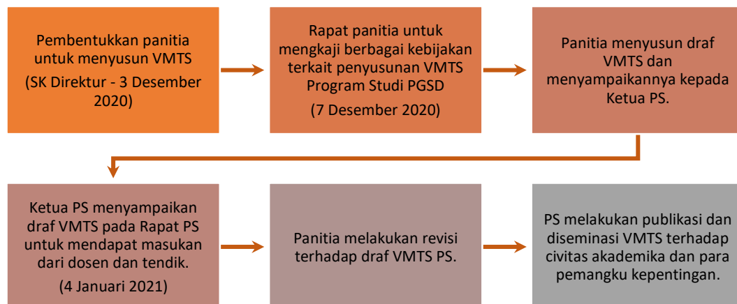
Gambar 1 Mekanisme penyusunan VMTS PGSD UPI Kampus Purwakarta

VMTS PGSD UPI Purwakarta disusun dengan mengacu pada mekanisme yang ditetapkan oleh universitas dan sejalan dengan VMTS UPI Kampus Purwakarta. Penyusunan VTMS PGSD UPI Kampus Purwakarta dilaksanakan bulan Desember 2020 sampai Januari 2021. Dimulai dari penetapan SK Direktur mengenai panitia penyusun VTMS PGSD UPI Kampus Purwakarta yang ditandatangani pada tanggal 3 Desember 2020. Mekanisme penetapan VMTS PGSD UPI Kampus Purwakarta dapat dilihat pada diagram di bawah ini.